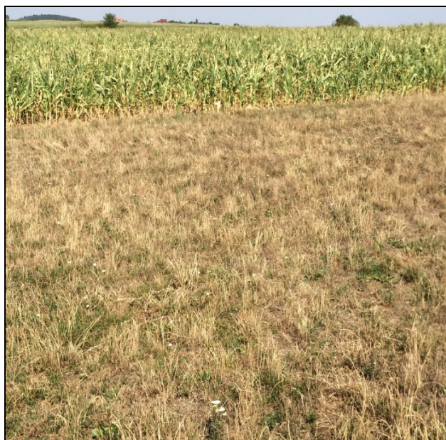
Obr. 2: Reakce kukuřice a trávy na dlouhodobé zemědělské sucho (Prokeš, 2015)

ská praxe bude schopná přizpůsobit nepředvídatelnosti klimatu, poněvadž se vedle suchých a extrémně teplých ročníků budou vyskytovat epizody nenadálých studených period (např. jarní měsíce v letech 2013 a 2017), které budou mít za následek poškození některých speciálních plodin anebo teplomilných kultur, mezi které patří kukuřice.