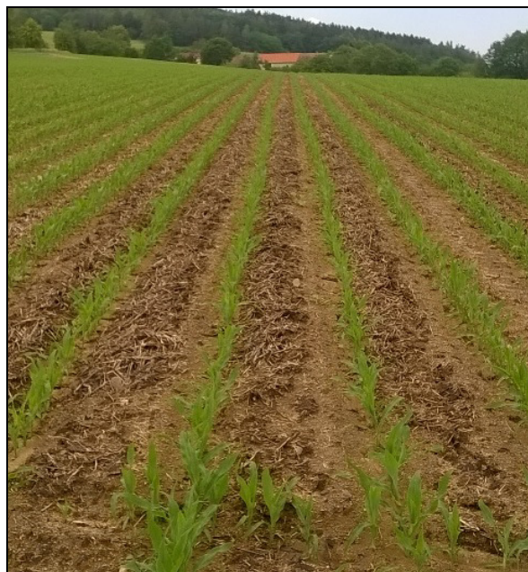
Obr. 3: Porost kukuřice založený metodou strip-till do meziplodiny svazenky vrtičolisté (Herout, 2018)

Vedle kukuřice využívají celou vegetační dobu ještě cukrovka, čirok a víceleté pícniny, z nichž především vojtěška má mimořádně vyvinutý kořenový systém se schopností přijímat vodu i z hlubokých vrstev půdy.