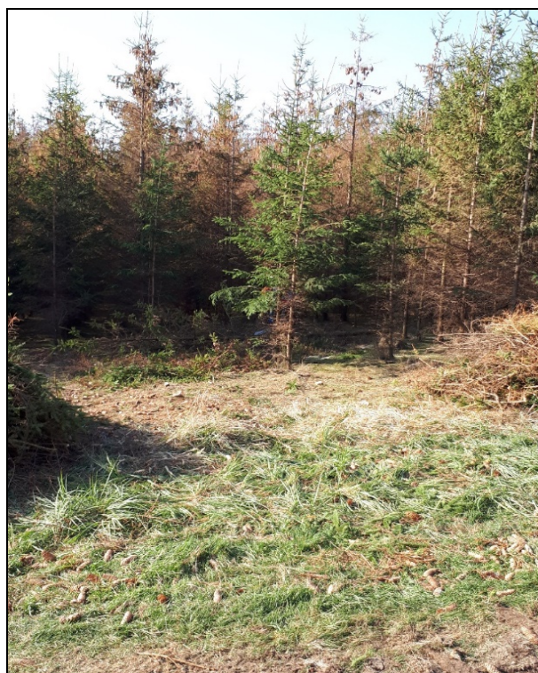
Obr. 1: Odumírající mladý smrkový les postižený suchem a kůrovcem, V.Meziříčí (Prokeš, 2018)

Z výše popsaného stavu je zjevné, že klimatická změna a s ní spojené turbulence budou ovlivňovat velmi významně všechny podnikatele i zaměstnance, kteří spojili svoje profese a životy s prací v živé přírodě a nepřímo i ostatní obyvatelstvo, které bude sužováno, zejména v městských aglomeracích, nesnesitelnými letními vedry a vedlejšími ekonomickými dopady (socio-ekonomické sucho).